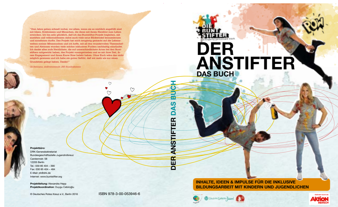
Handbuch des JRK-Projekts „Die Buntstifter“